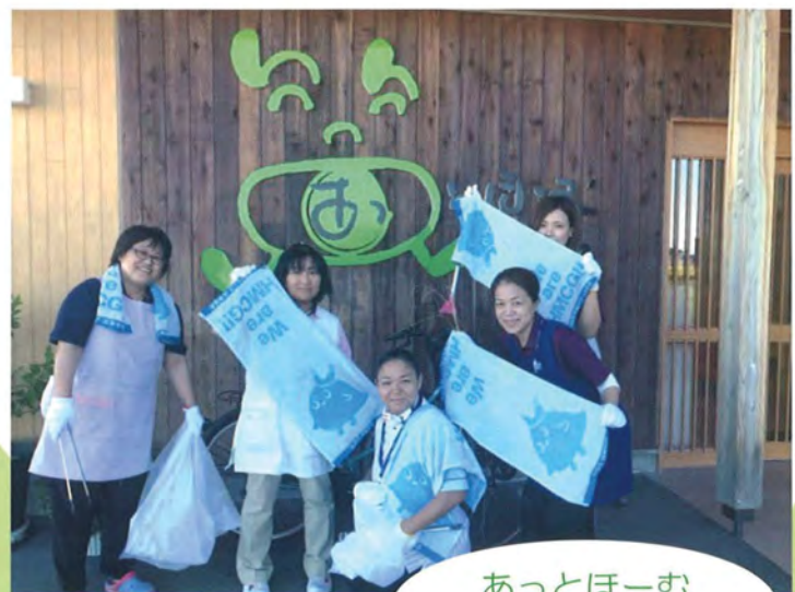
あっとほーむ 三好