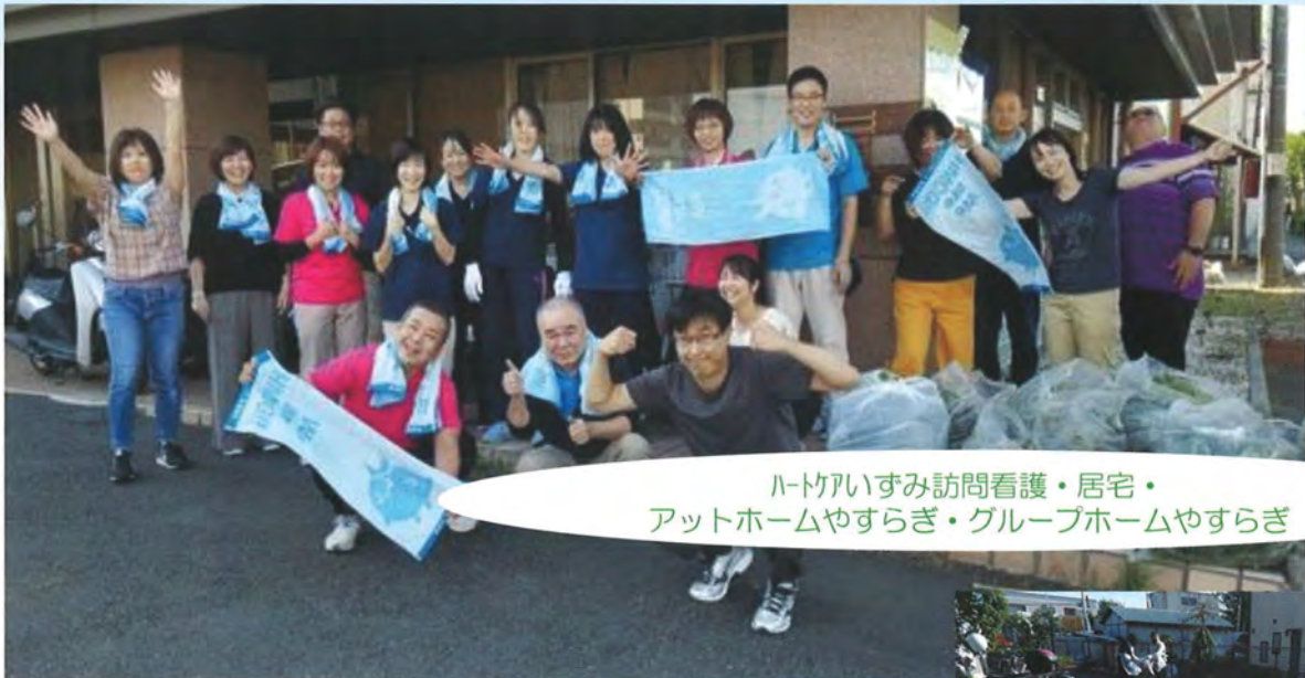
ハートアイすみ訪問看護・居宅・ アットホームやすらぎ・グループホームやすらぎ