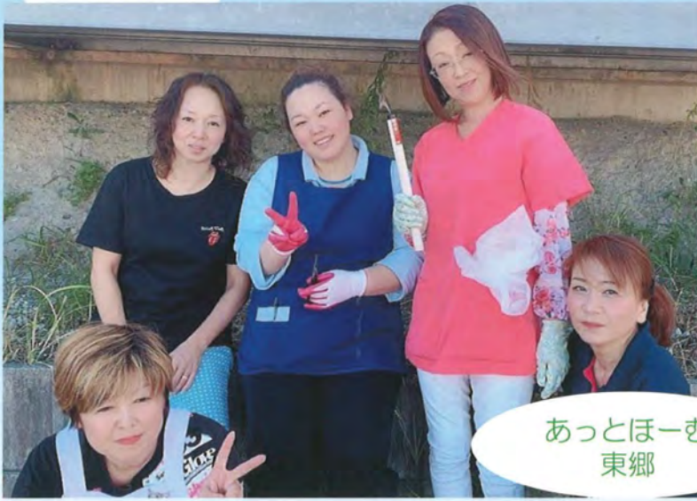
あっとほーむ 東郷