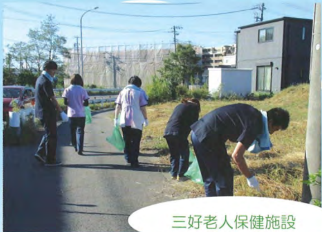
三好老人保健施設