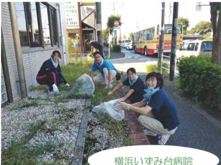
横浜いずみ台病院