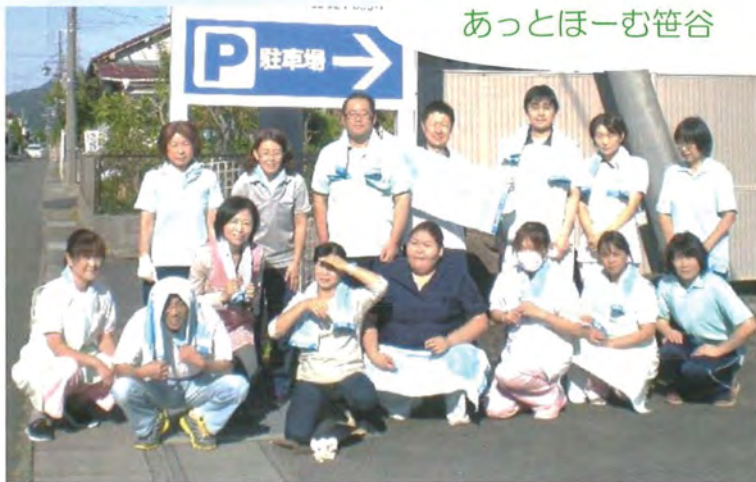
あっとほーむ笹谷