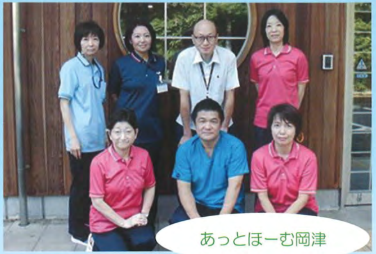
あっとほーむ岡津