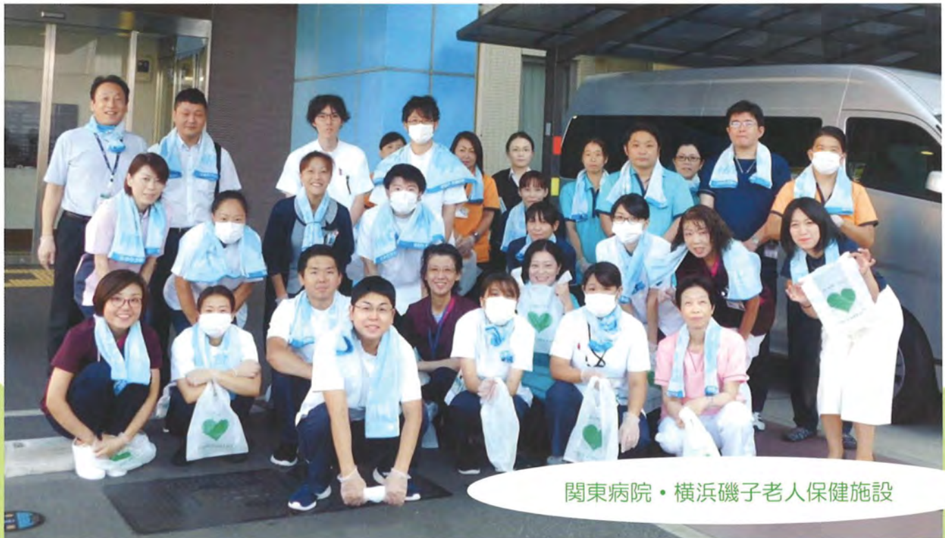
関東病院・横浜磯子老人保健施設