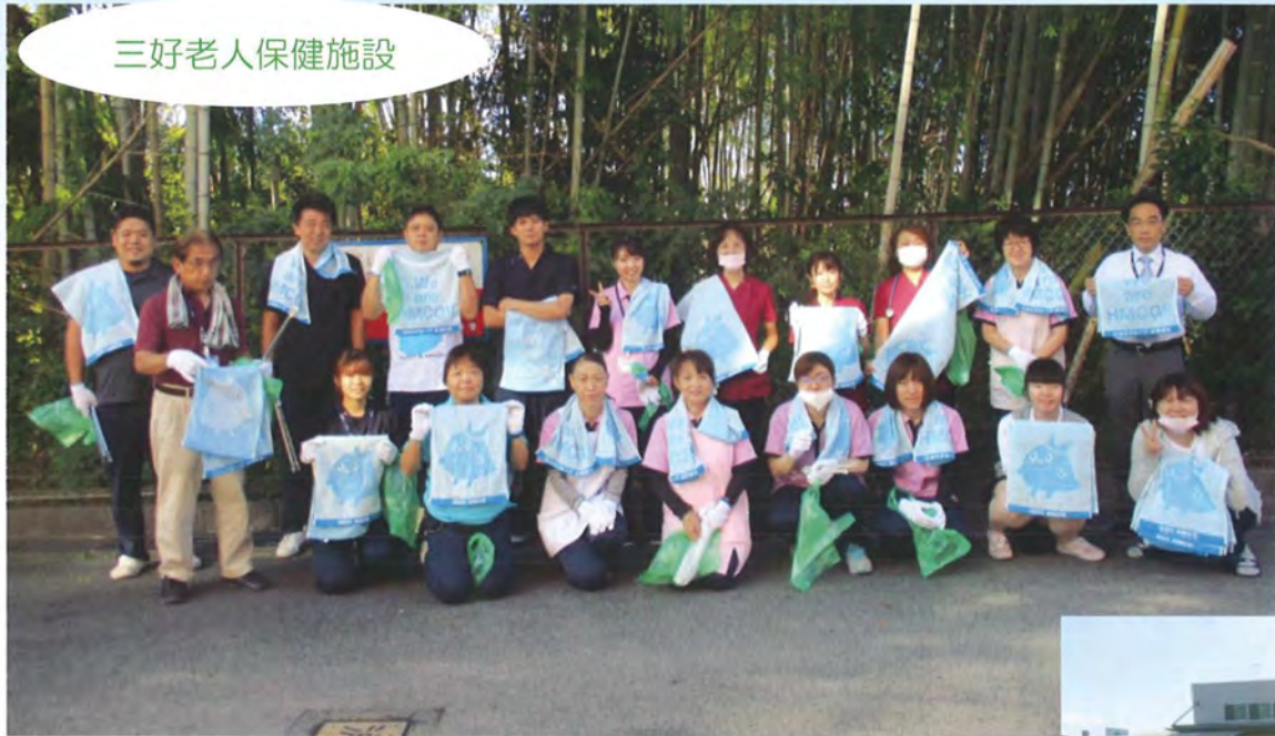
三好老人保健施設