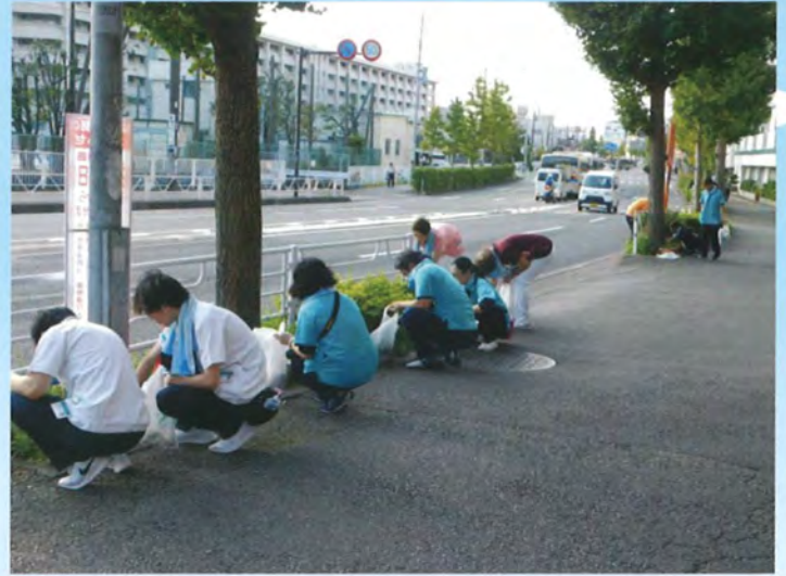
関東病院・横浜磯子老人保健施設