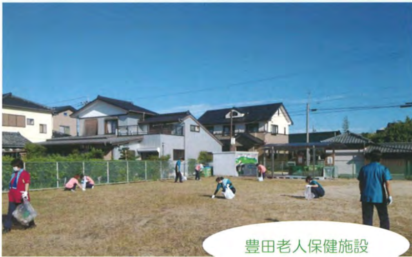
豊田老人保健施設