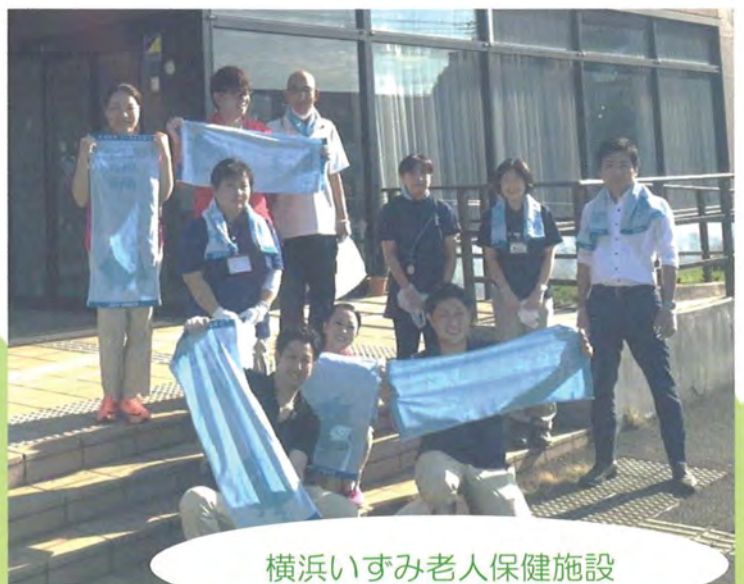
横浜いずみ老人保健施設